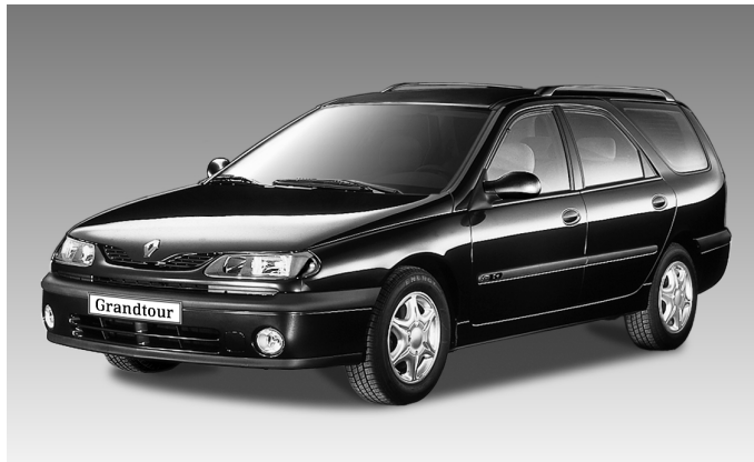
Laguna Grandtour Concorde